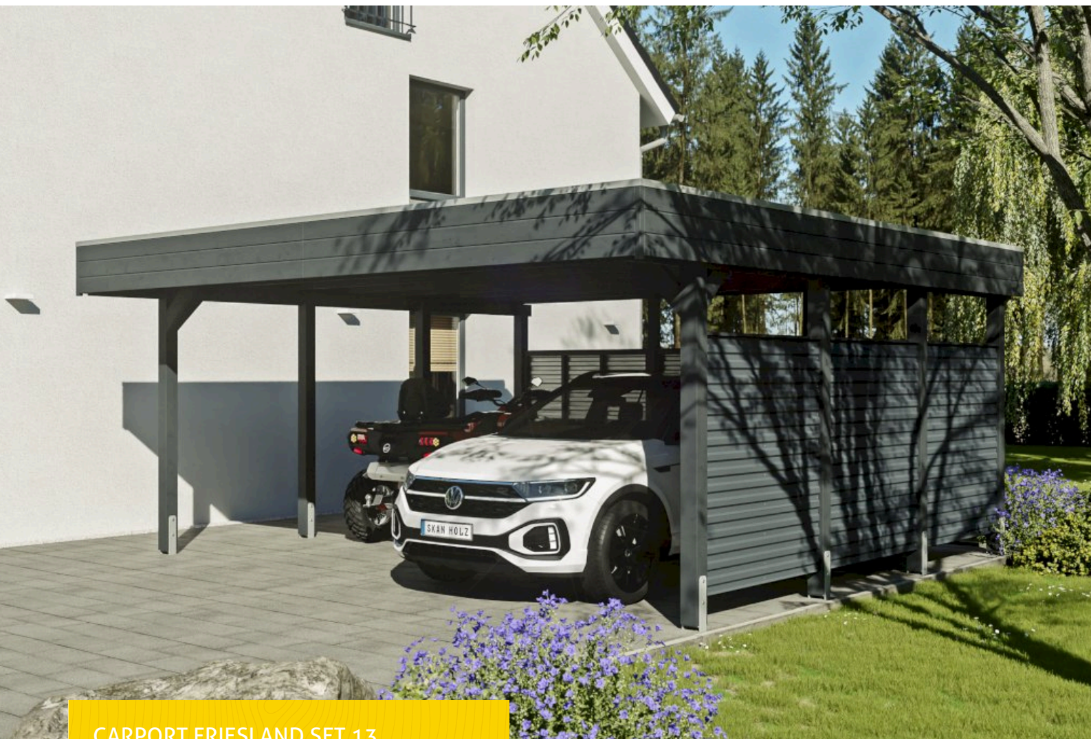
CARPORT FRIESLAND SET 13 557 x 555 cm