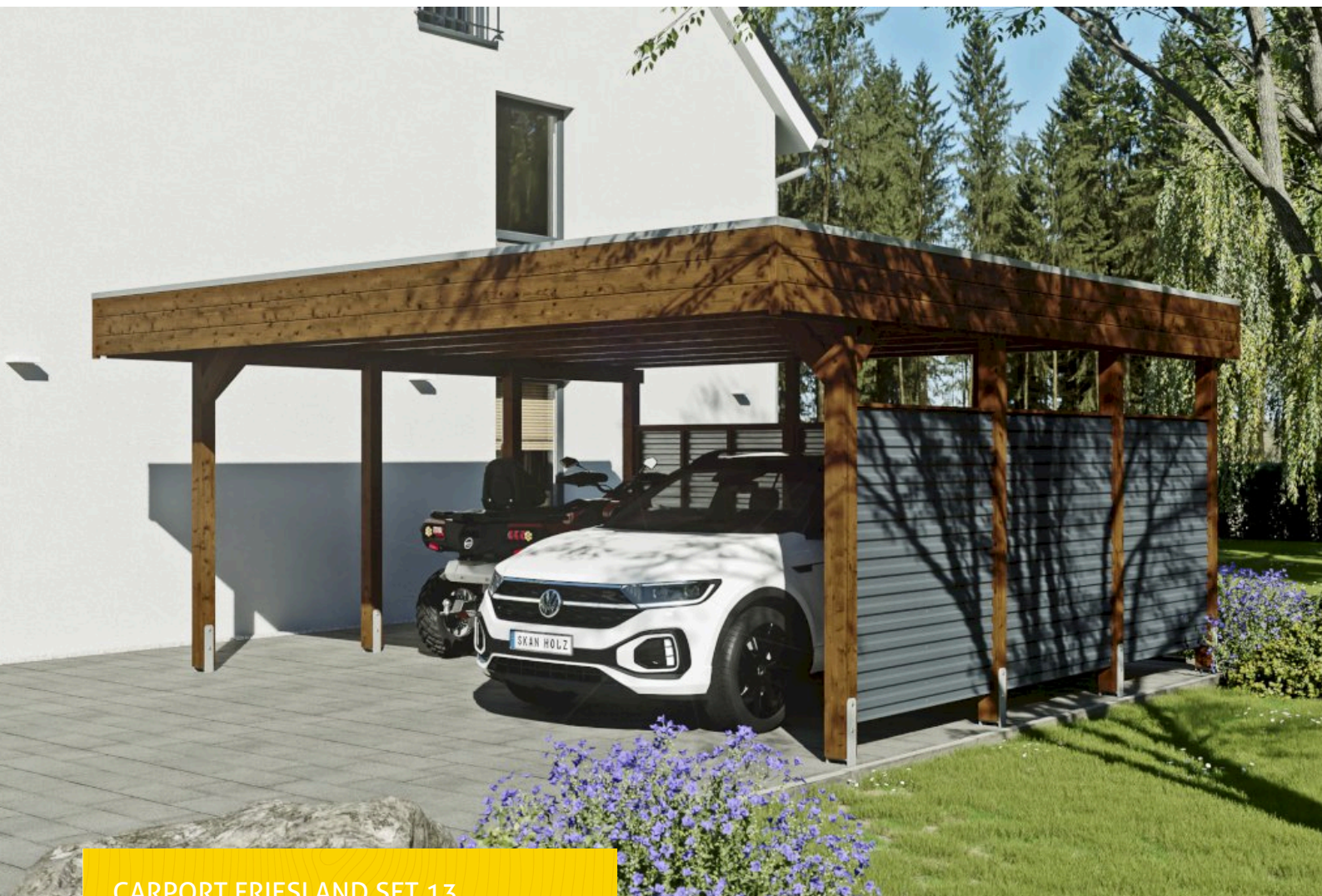
CARPORT FRIESLAND SET 13 557 x 555 cm