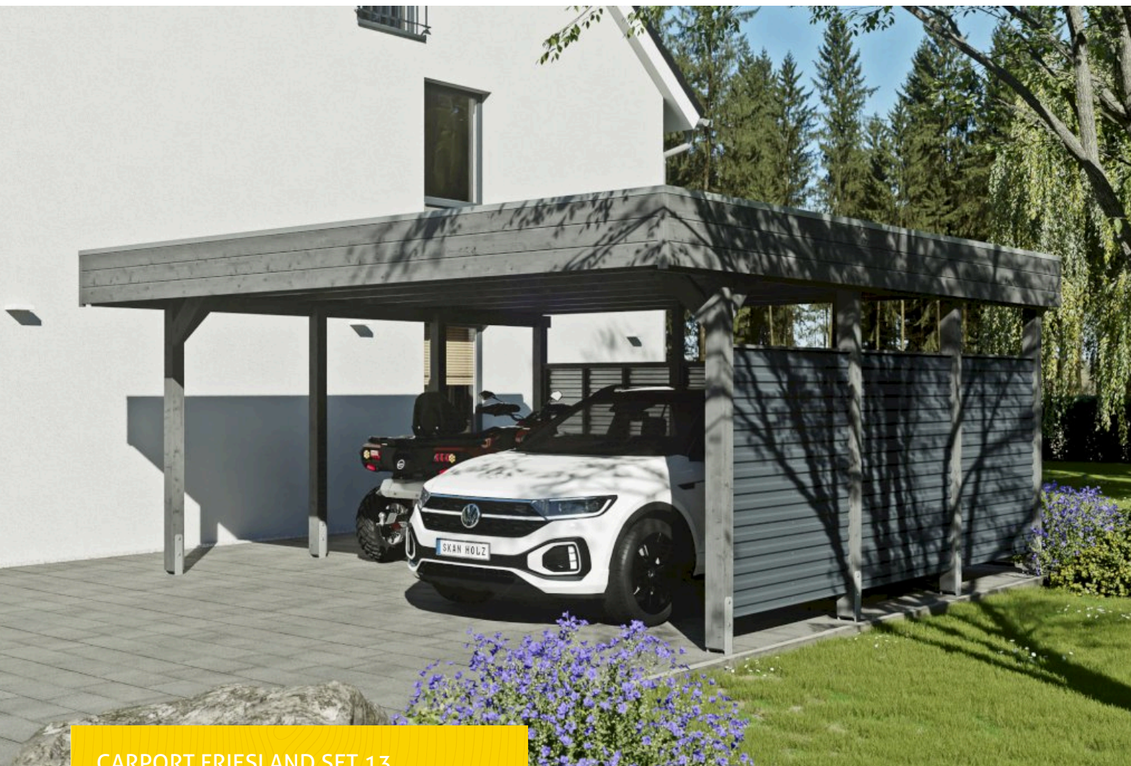
CARPORT FRIESLAND SET 13 557 x 555 cm