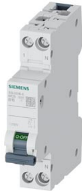
LEITUNGSSCHUTZSCHALTER 230V 6KA, 1+N-POLIG/1TE B16