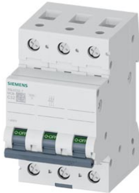
Leitungsschutzschalter 400V 6kA, 3-polig, C, 32A