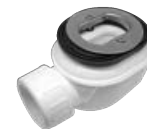
Válvula de 60 Caudal 35 L/m