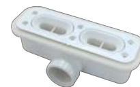
Válvula Doble Sifón Caudal 60 L/m