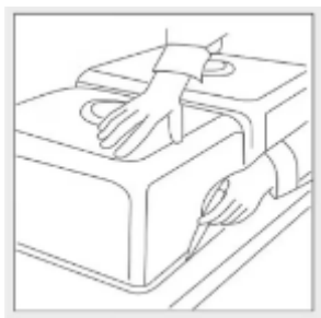
Presentamos el fregadero en la encimera y marcamos