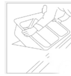
Encastramos y respetamos los tiempos de secado. Calafateamos para rematar

La principal ventaja de esta técnica de instalación es la simplicidad. Eliminar la necesidad de grapas reduce significativamente el tiempo y los esfuerzos requeridos para completar la instalación. Además, los adhesivos modernos ofrecen una fuerte unión que garantiza la estabilidad y la durabilidad del fregadero a lo largo del tiempo.