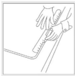
Calamos la encimera descontado el borde