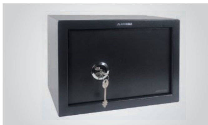
Cerradura de gorjas de doble paletón.