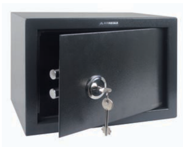
CLASS Ref. T-25K