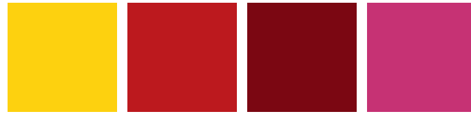
RAL 1021 RAPSGELB RAL 3000 FEUERROT RAL 3003 RUBINROT RAL 4010 TELEMAGENTA