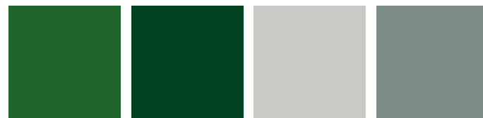
RAL 6002 LAUBGRÜN RAL 6005 MOOSGRÜN RAL 7035 LICHTGRAU RAL 7001 SILBERGRAU