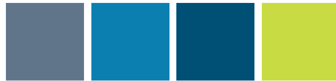
RAL 5014 TAUBENBLAU RAL 5015 HIMMELBLAU RAL 5010 ENZIANBLAU 6129 APFELGRÜN