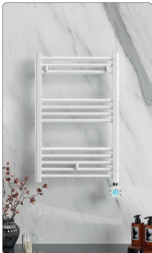
Modelo expuesto TELL2N40B77 - Elba Plus 300W blanco