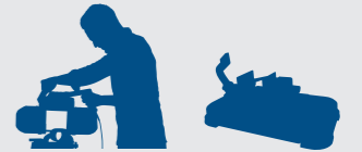
2 in 1