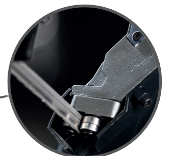
Kugelgelagerte Führungen für einen sauberen Lauf des Bandes