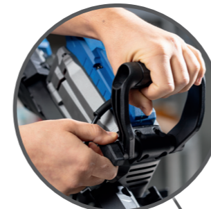
Verstellbarer Handgriff ermöglicht eine optimale Anpassung an die Anwendung