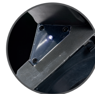
LED-Arbeitslicht sorgt auch bei schwierigen Lichtverhältnissen für eine optimale Sicht