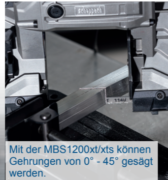
Mit der MBS1200xt/xts können Gehrungen von 0° - 45° gesägt werden.