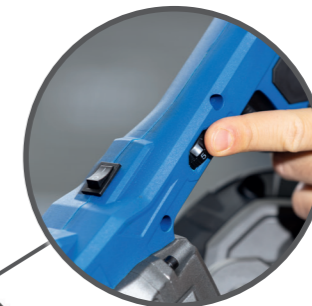
Variable Drehzahlverstellung ermöglicht materialgerechtes Arbeiten