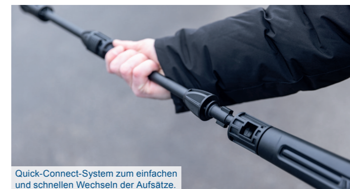
Quick-Connect-System zum einfachen und schnellen Wechseln der Aufsätze.