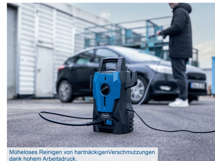
Mühesloses Reinigen von hartnäckigen Verschmutzungen dank hohem Arbeitsdruck.