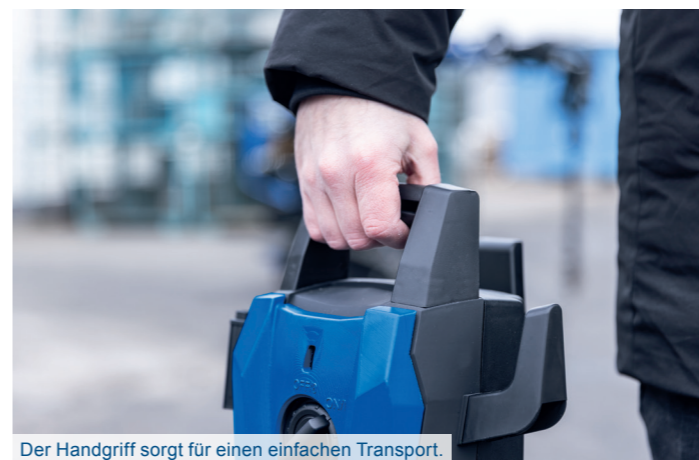
Der Handgriff sorgt für einen einfachen Transport.