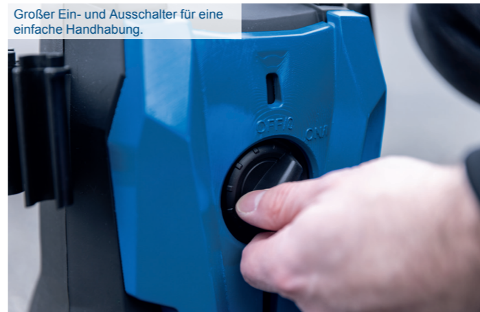
Großer Ein- und Ausschalter für eine einfache Handhabung.