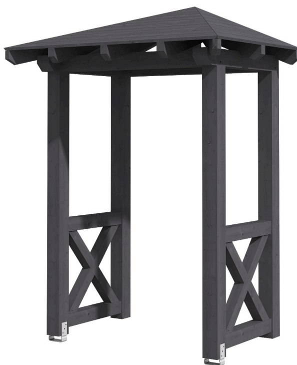
VORDACH WESEL 4 188 x 126 cm

Massive Konstruktion aus Konstruktionsvollholz (KVH-Fichte)