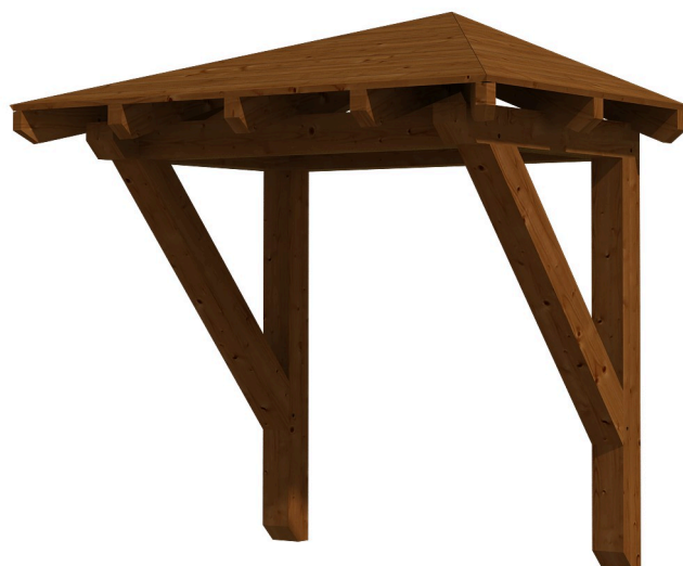
VORDACH WESEL 1 188 x 126 cm

Massive Konstruktion aus Konstruktionsvollholz (KVH-Fichte)