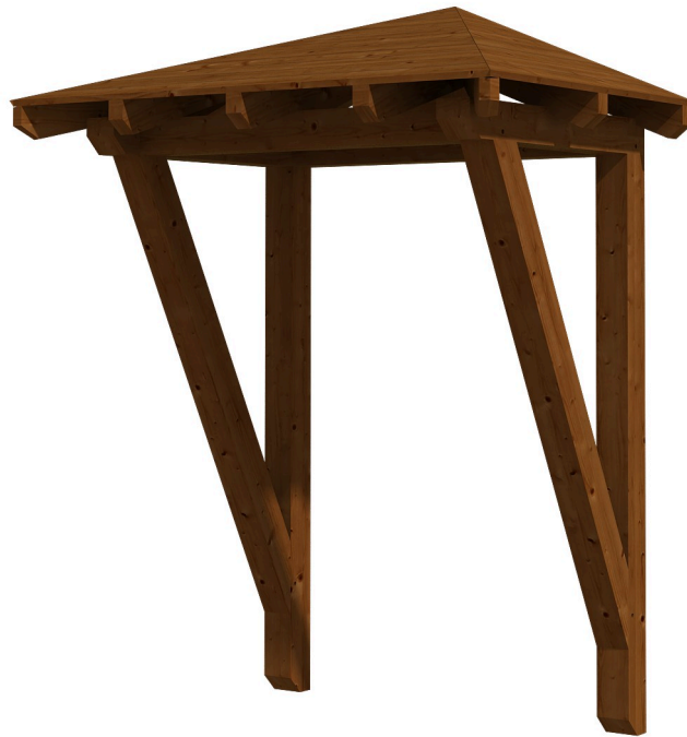
VORDACH WESEL 2 188 x 126 cm

Massive Konstruktion aus Konstruktionsvollholz (KVH-Fichte)