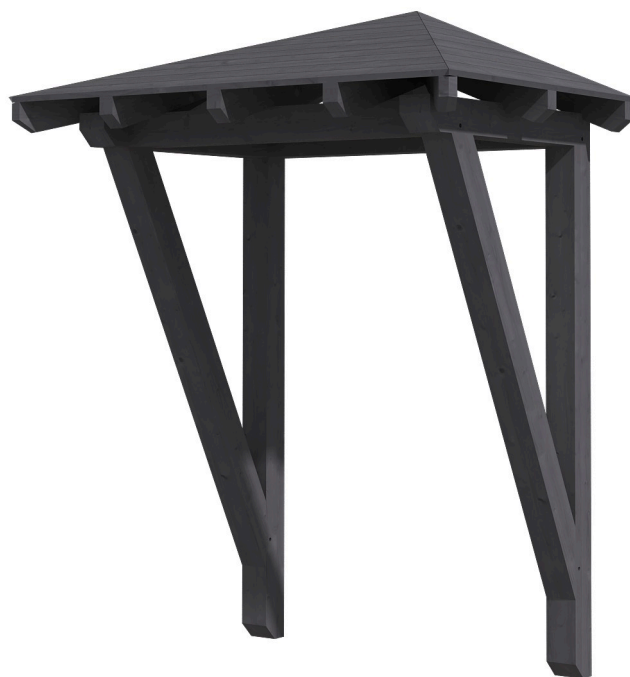
VORDACH WESEL 2 188 x 126 cm

Massive Konstruktion aus Konstruktionsvollholz (KVH-Fichte)