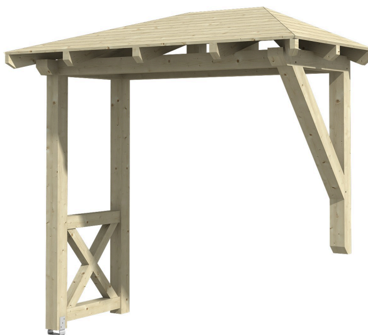
VORDACH WISMAR 3 258 x 126 cm

Massive Konstruktion aus Konstruktionsvollholz (KVH-Fichte)