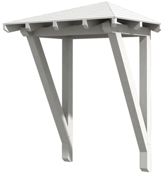
VORDACH WESEL 2 188 x 126 cm

Massive Konstruktion aus Konstruktionsvollholz (KVH-Fichte)