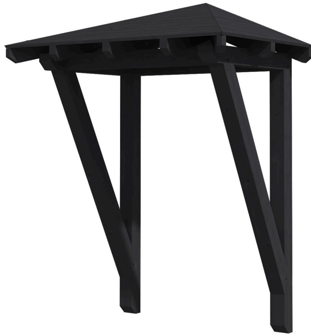
VORDACH WESEL 2 188 x 126 cm

Massive Konstruktion aus Konstruktionsvollholz (KVH-Fichte)