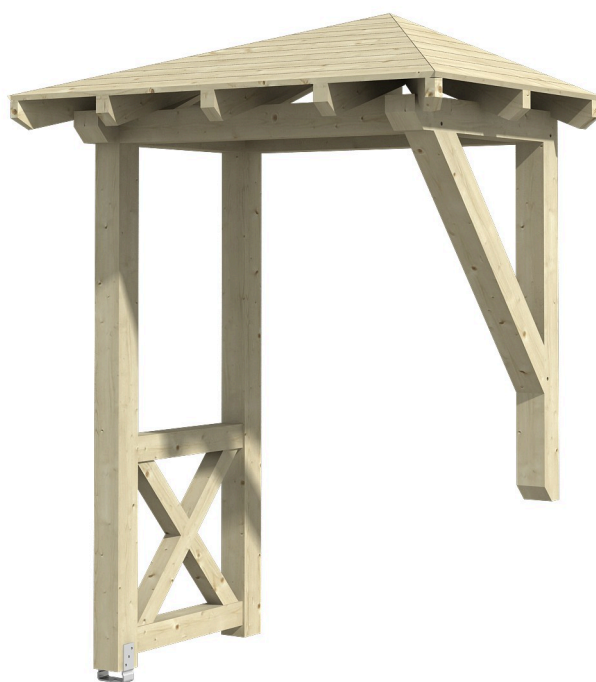
VORDACH WESEL 3 188 x 126 cm

Massive Konstruktion aus Konstruktionsvollholz (KVH-Fichte)