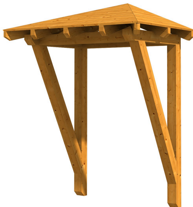
VORDACH WESEL 2 188 x 126 cm

Massive Konstruktion aus Konstruktionsvollholz (KVH-Fichte)