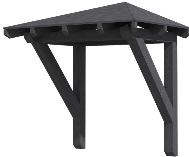
VORDACH WESEL 1 188 x 126 cm

Massive Konstruktion aus Konstruktionsvollholz (KVH-Fichte)