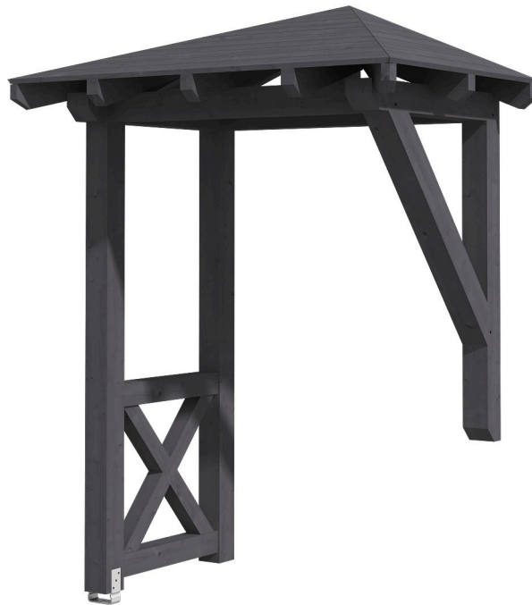
VORDACH WESEL 3 188 x 126 cm

Massive Konstruktion aus Konstruktionsvollholz (KVH-Fichte)