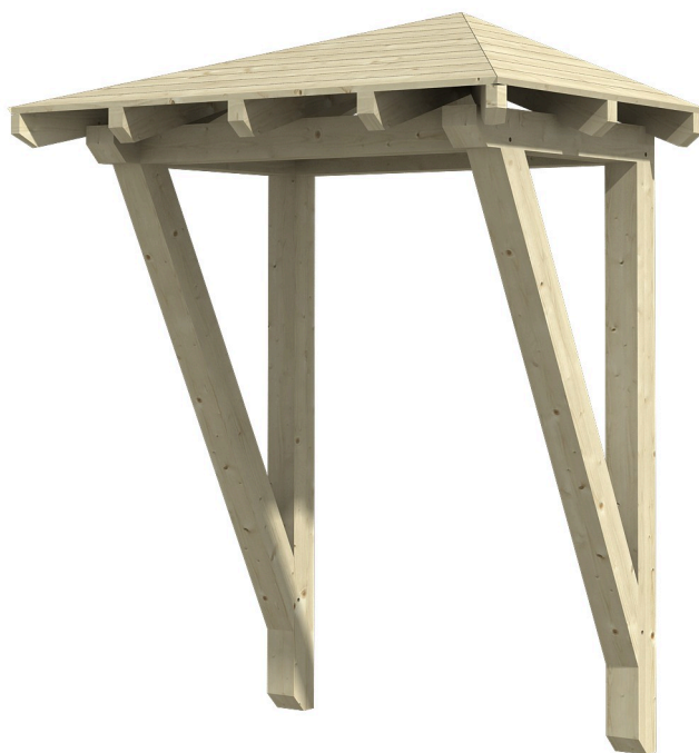
VORDACH WESEL 2 188 x 126 cm

Massive Konstruktion aus Konstruktionsvollholz (KVH-Fichte)