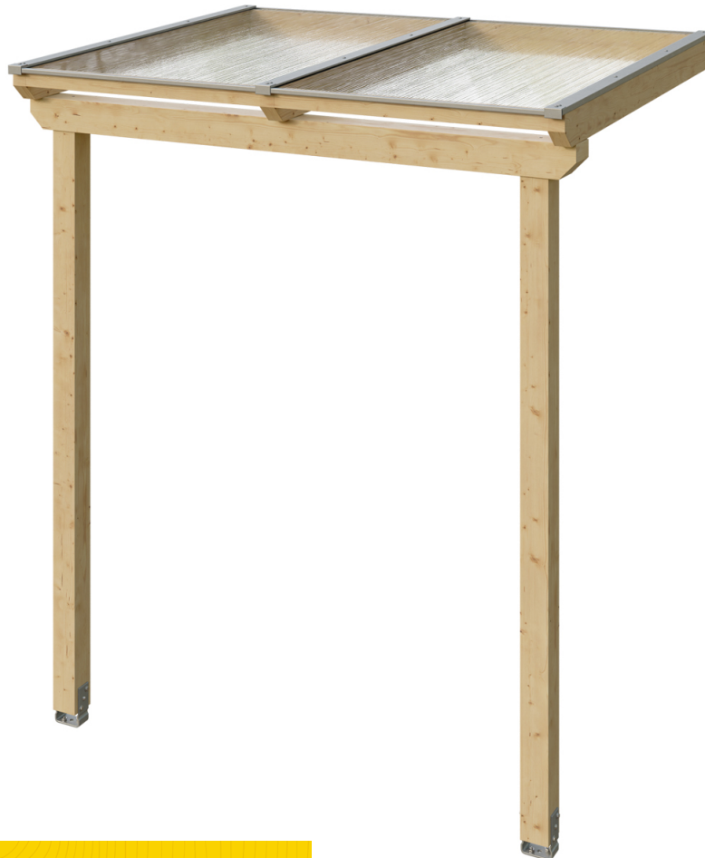
VORDACH ANKLAM 2 220 x 174 cm

Massive Konstruktion aus hochwertigem Leimholz (BSH-Fichte)