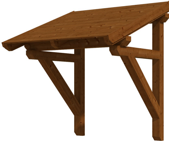
VORDACH POTSDAM 1 176 x 156 cm

Massive Konstruktion aus Konstruktionsvollholz (KVH-Fichte)