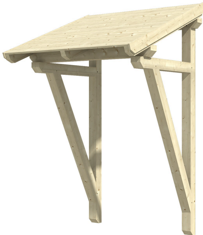
VORDACH POTSDAM 2 176 x 156 cm

Massive Konstruktion aus Konstruktionsvollholz (KVH-Fichte)