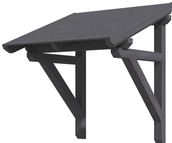
VORDACH POTSDAM 1 176 x 156 cm

Massive Konstruktion aus Konstruktionsvollholz (KVH-Fichte)