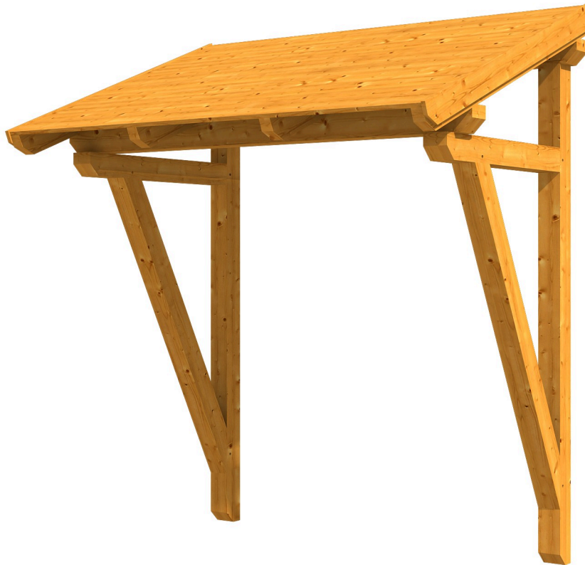
VORDACH PADERBORN 2 242 x 156 cm

Massive Konstruktion aus Konstruktionsvollholz (KVH-Fichte)