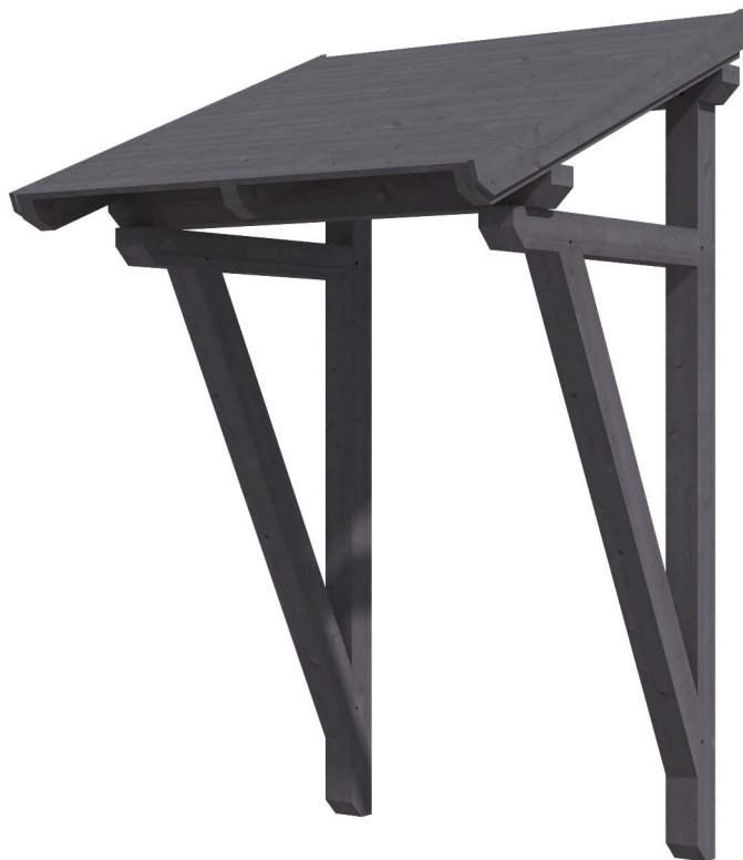
VORDACH POTSDAM 2 176 x 156 cm

Massive Konstruktion aus Konstruktionsvollholz (KVH-Fichte)