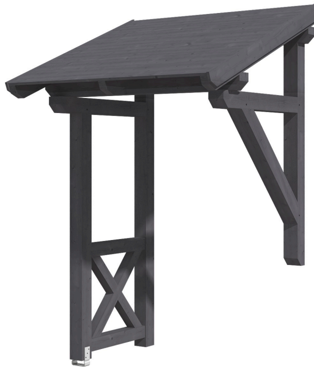
VORDACH POTSDAM 3 176 x 156 cm

Massive Konstruktion aus Konstruktionsvollholz (KVH-Fichte)