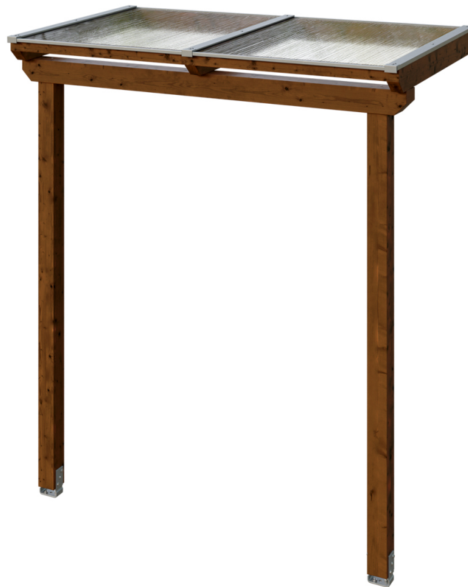
VORDACH ANKLAM 1 220 x 124 cm

Massive Konstruktion aus hochwertigem Leimholz (BSH-Fichte)