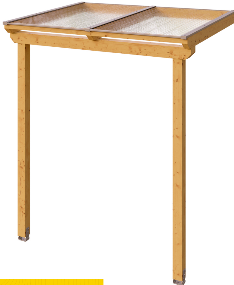
VORDACH ANKLAM 2 220 x 174 cm

Massive Konstruktion aus hochwertigem Leimholz (BSH-Fichte)