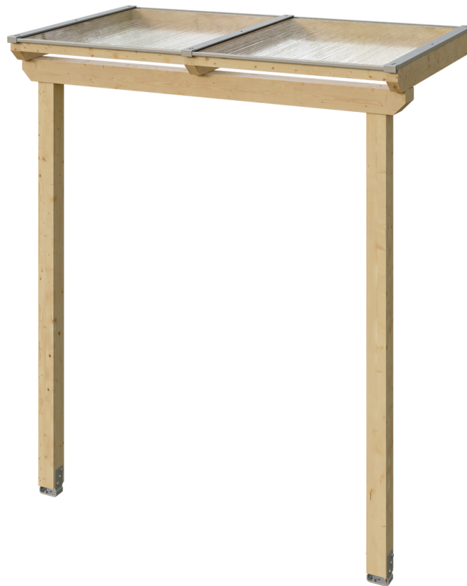
VORDACH ANKLAM 1 220 x 124 cm

Massive Konstruktion aus hochwertigem Leimholz (BSH-Fichte)