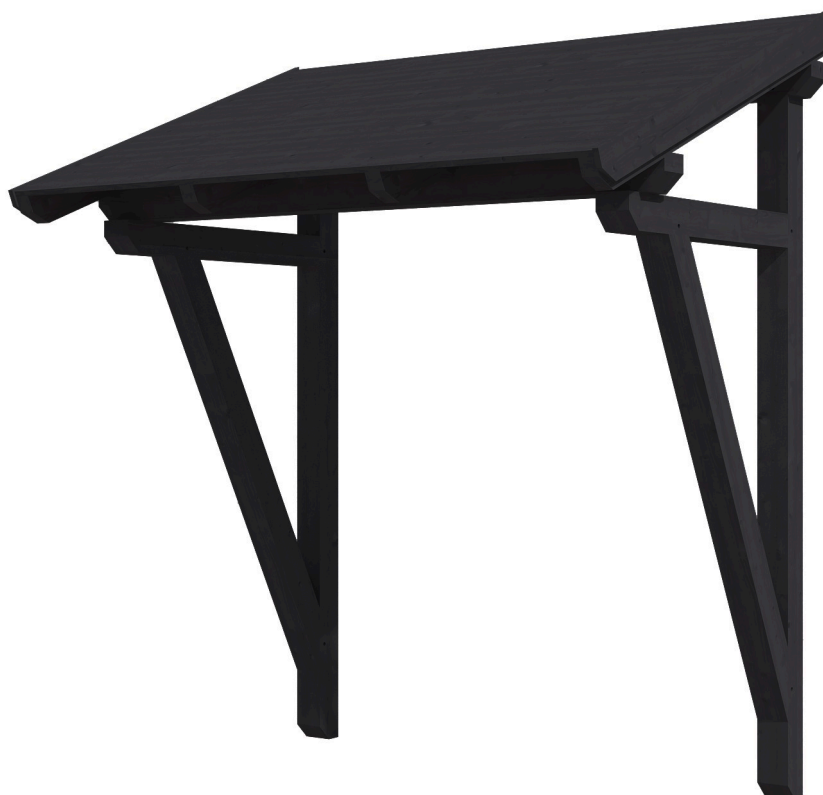
VORDACH PADERBORN 2 242 x 156 cm

Massive Konstruktion aus Konstruktionsvollholz (KVH-Fichte)