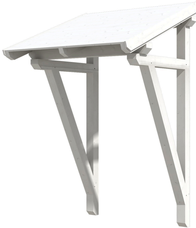
VORDACH POTSDAM 2 176 x 156 cm

Massive Konstruktion aus Konstruktionsvollholz (KVH-Fichte)