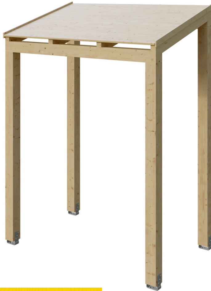
VORDACH PUTBUS 203 x 128 cm

Massive Konstruktion aus hochwertigem Leimholz (BSH-Fichte)