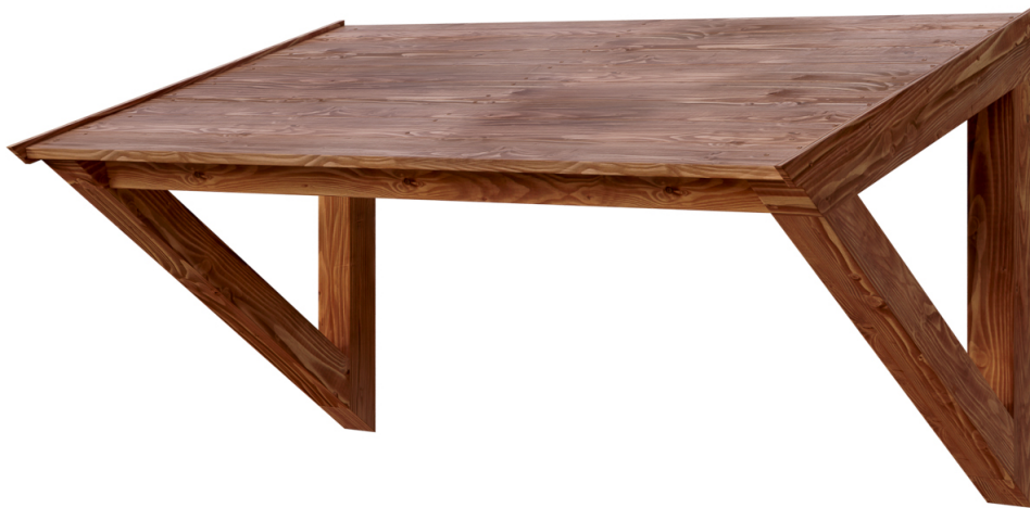
VORDACH POEL 148 x 87 cm

Massive Konstruktion aus hochwertiger Douglasie