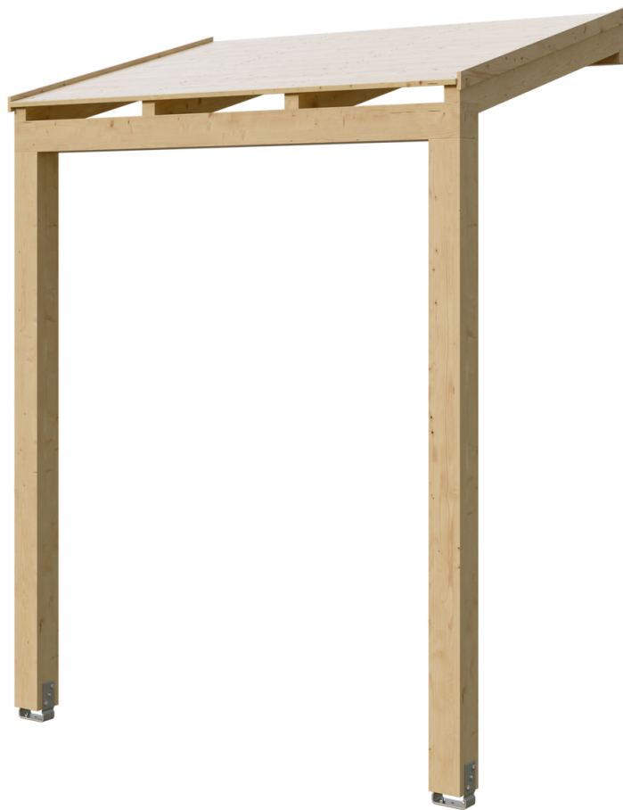
VORDACH PREROW 203 x 128 cm

Massive Konstruktion aus hochwertigem Leimholz (BSH-Fichte)