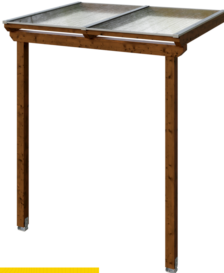
VORDACH ANKLAM 2 220 x 174 cm

Massive Konstruktion aus hochwertigem Leimholz (BSH-Fichte)