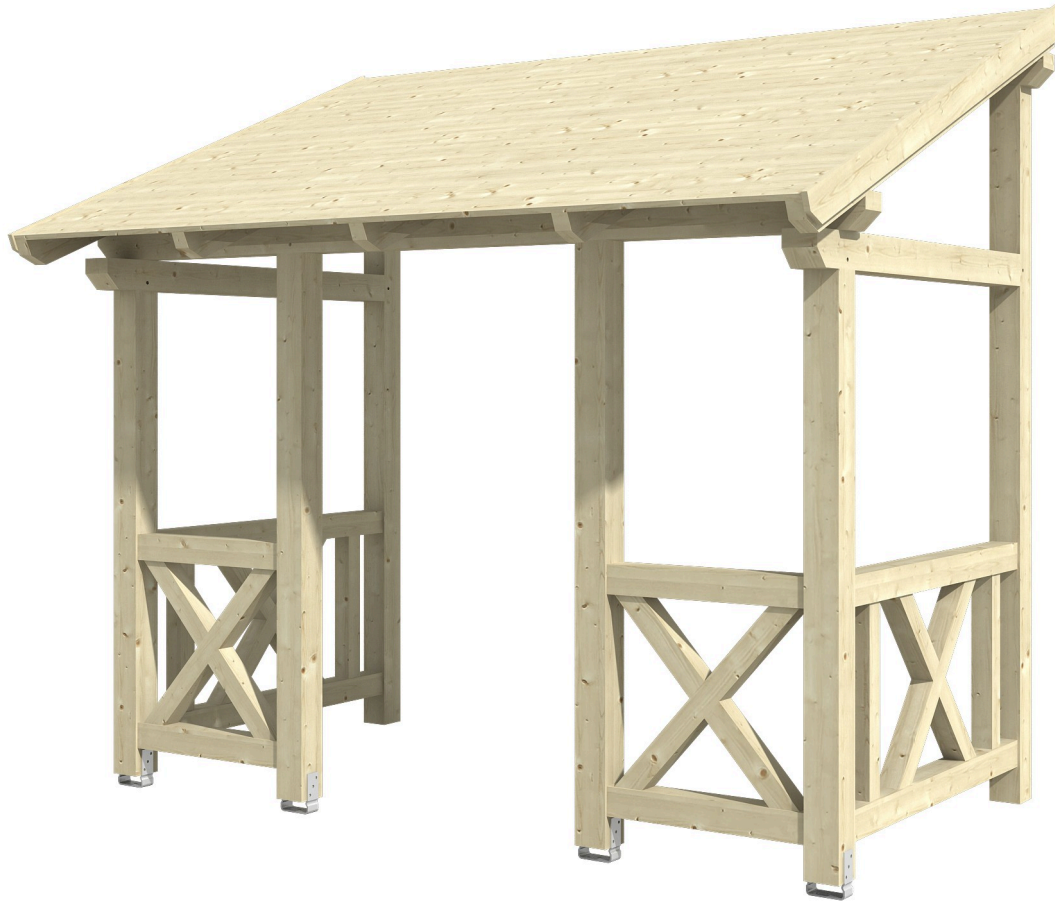
VORDACH PADERBORN 7 336 x 202 cm

Massive Konstruktion aus Konstruktionsvollholz (KVH-Fichte)