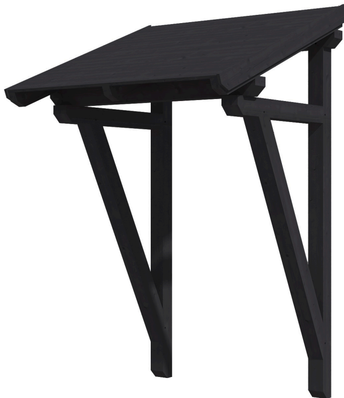
VORDACH POTSDAM 2 176 x 156 cm

Massive Konstruktion aus Konstruktionsvollholz (KVH-Fichte)