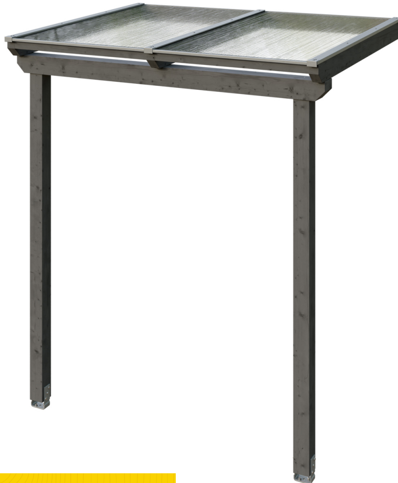
VORDACH ANKLAM 2 220 x 174 cm

Massive Konstruktion aus hochwertigem Leimholz (BSH-Fichte)