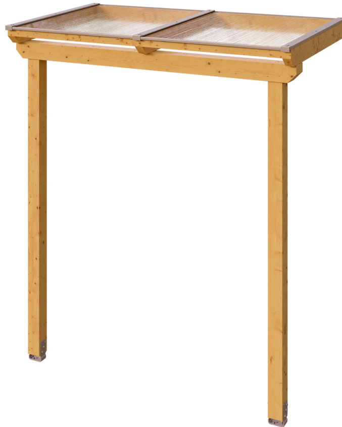
VORDACH ANKLAM 1 220 x 124 cm

Massive Konstruktion aus hochwertigem Leimholz (BSH-Fichte)