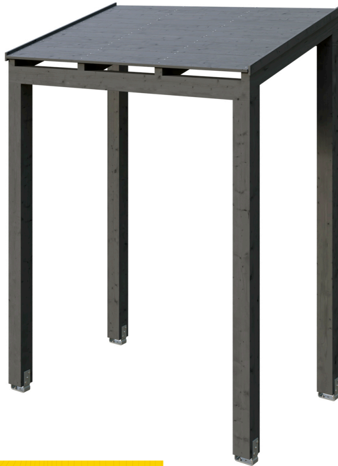
VORDACH PUTBUS 203 x 128 cm

Massive Konstruktion aus hochwertigem Leimholz (BSH-Fichte)