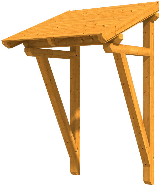
VORDACH POTSDAM 2 176 x 156 cm

Massive Konstruktion aus Konstruktionsvollholz (KVH-Fichte)