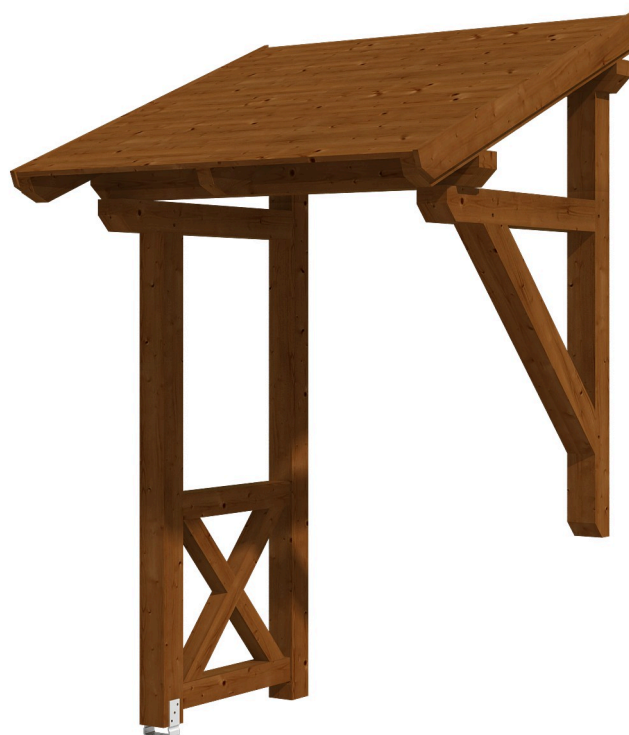
VORDACH POTSDAM 3 176 x 156 cm

Massive Konstruktion aus Konstruktionsvollholz (KVH-Fichte)