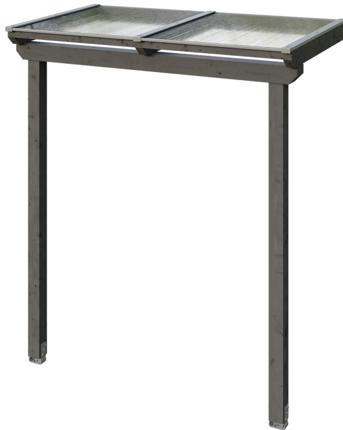
VORDACH ANKLAM 1 220 x 124 cm

Massive Konstruktion aus hochwertigem Leimholz (BSH-Fichte)