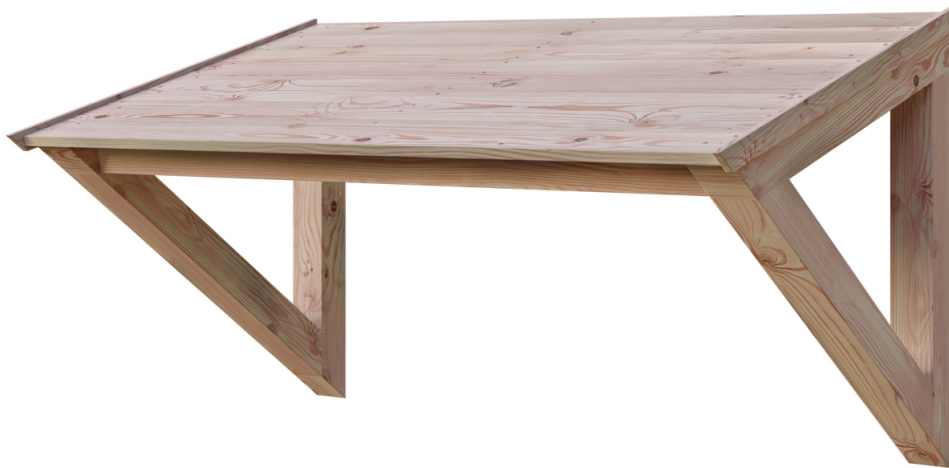
VORDACH POEL 148 x 87 cm

Massive Konstruktion aus hochwertiger Douglasie